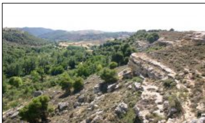
Zona de la carrera